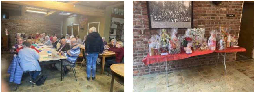
Kienen, Wielderhoes (maart en oktober 2025)

Twee keer werd er in 2025 gekiend (geen wonder met die prijzen!)