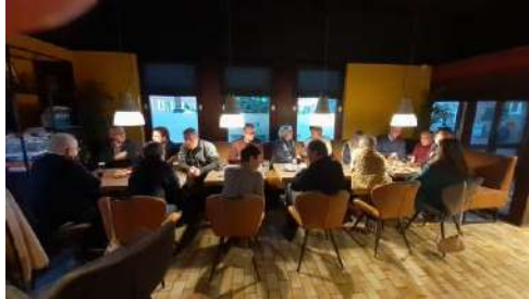
Vrijwilligers middag 22-11-2025

Een ander hoogtepunt was de jaarlijkse vrijwilligersbijeenkomst, altijd belangrijk onder het motto: zorg goed voor elkaar, maar ook goed voor jezelf.