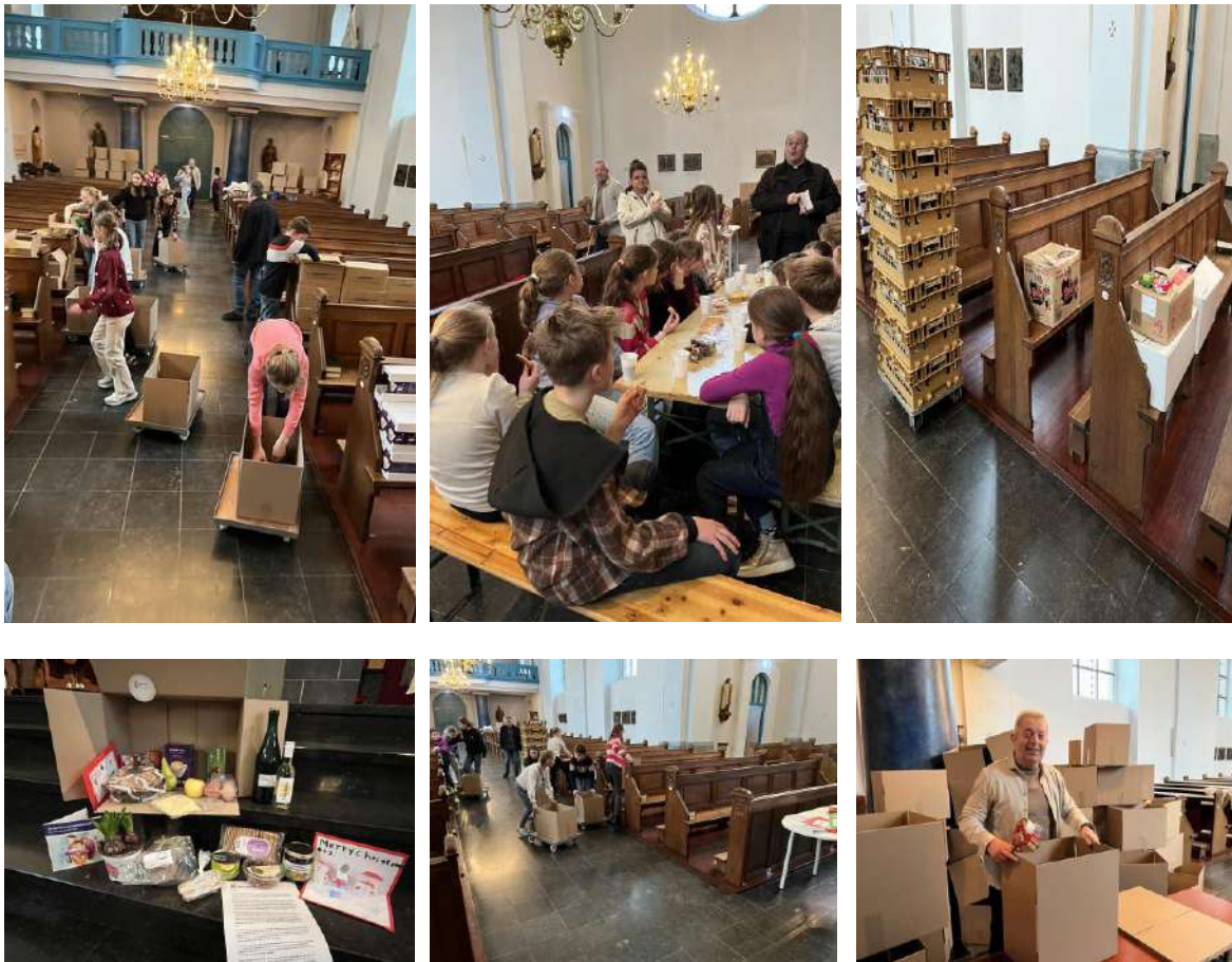
Kerstpakketten inpakken in de kerk

De kinderen van groep 7/8 hebben geholpen bij het inpakken van 120 kerstpakketten in de kerk.