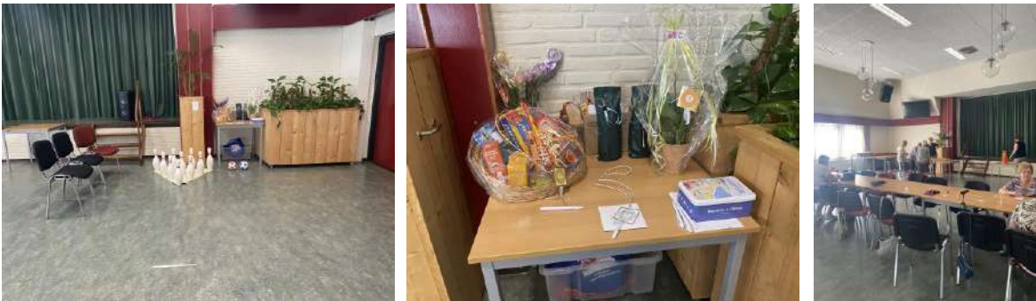
Spellen middag in Wielderhoes (augustus 2025)

Een super prestatie van het jaar was dat de vrijwilligers van “De Hoeskamer” en de klus en tuinonderhoud groep van “de Paus Franciscus groep” op gestage manier doorgingen met hun activiteiten ondanks dat er wat minder mensen waren die de weg naar hun wisten te vinden.