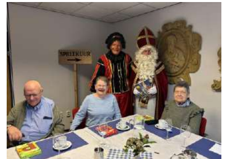
Sinterklaas kwam langs in de Hoeskamer