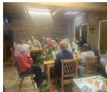
Bij Hazen-Wijnen werden Kerststukjes gemaakt.

Het aantal Kerstpakketten is vorig jaar weer licht gegroeid. Van 124 in 2023 naar 100 in 2024 maar weer omhoog naar 110 in 2025.