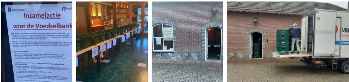
Inzamel actie voor de voedselbank

Ook het verzamelen en doorsturen van etenswaren voor de voedselbank in december was ook dit jaar weer een groot succes. Zowel op de 10 Bunder school als naast de kerk kon worden ingeleverd. De voedselbank uit Landgraaf kon in Wijlre ruim 50 kratten etenswaar ophalen voor verdere verdeling en waarmee honderden mensen geholpen worden tijdens de kerstperiode.