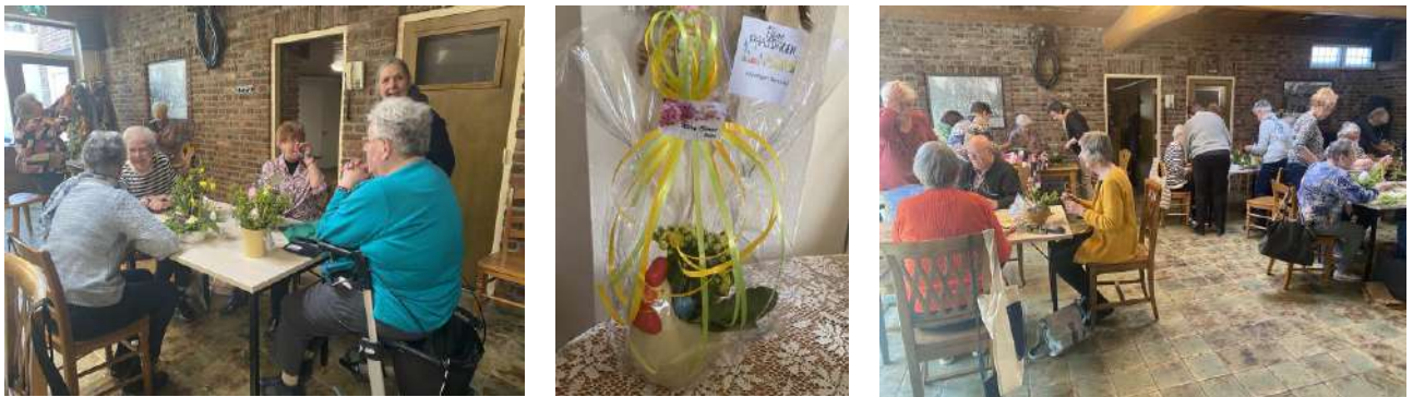
Paas attenties maken bij Hazen-Wijnen (april 2025)